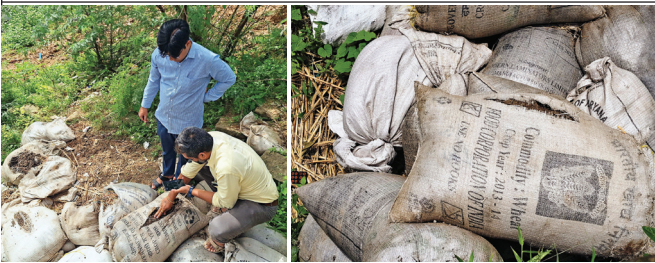
રથળ ઉપર મેડિકલ વેસ્ટનો ગેરકાયદે નિકાલ

ખાતરના જથ્થામાં ફૂડ કોર્પોરેશન ઓફ ઈન્ડિયા લખેલી અનેક બોરીઓ કોણે, શા માટે ફેંકી હશે ?