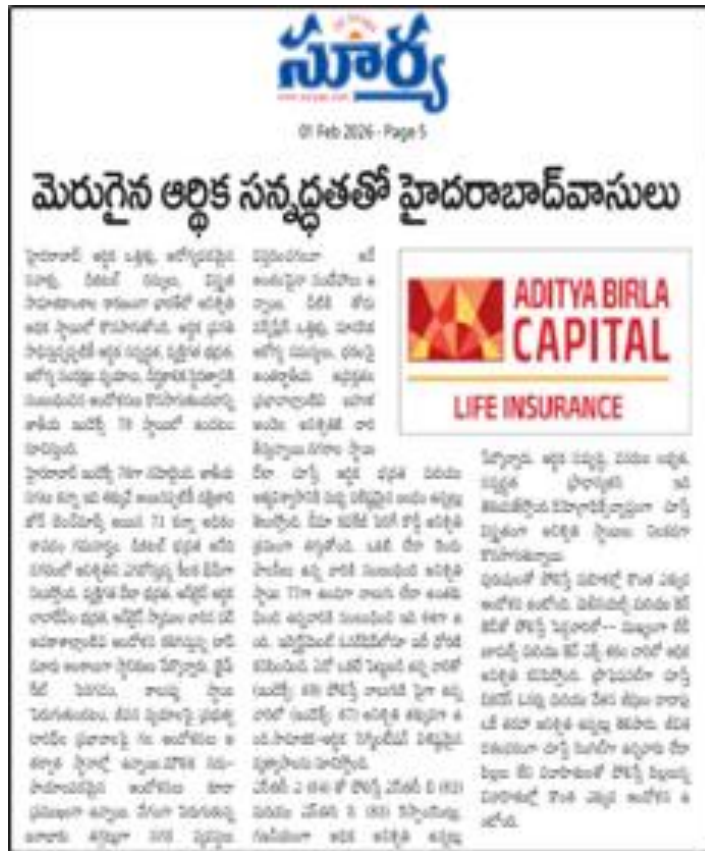
Title: Hyderabadis with better financial preparedness